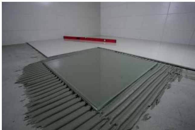
Doskonałe parametry robocze pozwalają na uzyskanie 100% rozpliwu zaprawy CM 22 pod płytką

Dylatacje między płytkami, spoiny w narożach ścian, w połączeniach ścian z posadzką i przy urządzeniach sanitarnych należy wypełnić silikonem Ceresit CS 25 MicroProtect.