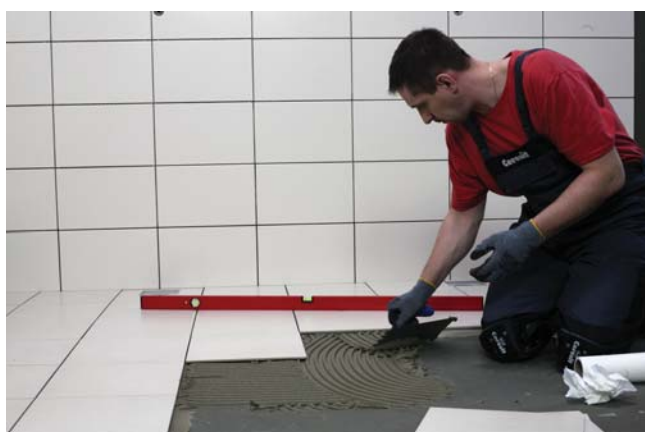
Nawet w przypadku aplikacji pacą zębatą o dużych zębach brak efektu rolowania zaprawy na podłożu. Dodatkowo po każdorazowym przeciągnięciu pacą czynność ta staje się łatwiejsza