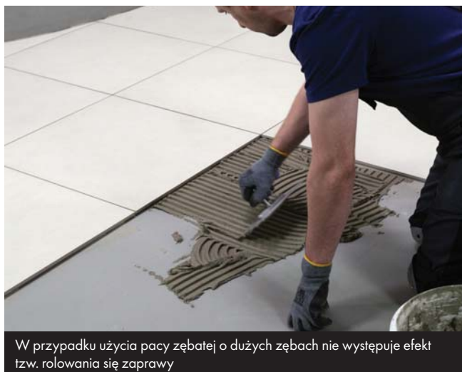
W przypadku użycia pacy zębatej o dużych zębach nie występuje efekt tzw. rolowania się zaprawy

Istniejące zabrudzenia, warstwy zwietrzałe i powłoki malarskie o niskiej wytrzymałości należy usunąć mechanicznie. Podłoża nasiąkliwe zagruntować preparatem Ceresit CT 17 i odczekać do wyschnięcia co najmniej 2 godziny. Nierówności podłoża do 5 mm mogą być dzień wcześniej wypełnione zaprawą CM 17. W przypadku większych nierówności i ubytków – na posadzkach należy zastosować materiały Ceresit z grupy CN, a na ścianach szpachlówkę Ceresit CT 29.