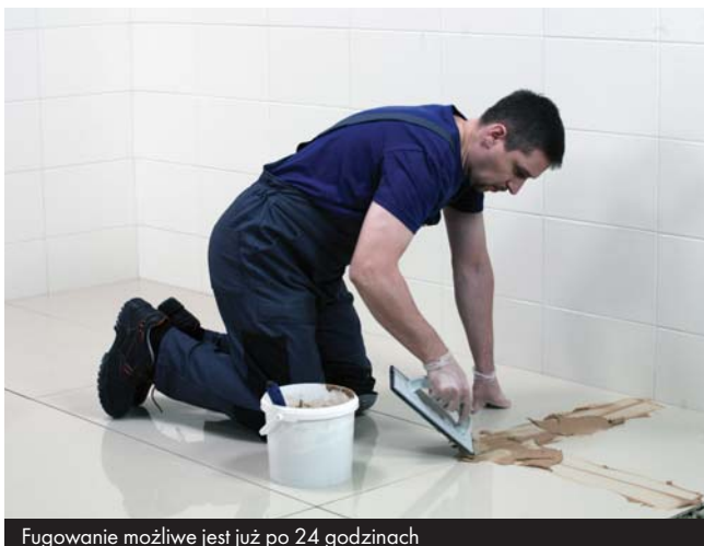
Fugowanie możliwe jest już po 24 godzinach