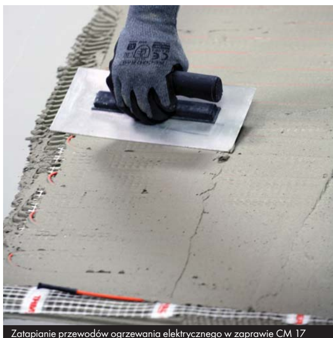
Zatapianie przewodów ogrzewania elektrycznego w zaprawie CM 17

Istniejące zabrudzenia, warstwy zwietrzałe i powłoki malarskie o niskiej wytrzymałości należy usunąć mechanicznie. Podłoża nasiąkliwe zagruntować preparatem Ceresit CT 17 i odczekać do wyschnięcia co najmniej 2 godziny. Nierówności podłoża do 5 mm mogą być dzień wcześniej wypełnione zaprawą CM 17. W przypadku większych nierówności i ubytków – na posadzkach należy zastosować materiały Ceresit z grupy CN, a na ścianach szpachlówkę Ceresit CT 29.