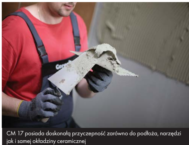
CM 17 posiada doskonałą przyczepność zarówno do podłoża, narzędzi jak i samej okładziny ceramicznej

Zaprawę rozprowadzać po podłożu pacą zębatą. Wielkość zębów pacy zależy od wielkości płytek. Prawidłowo dobrana konsystencja i wielkość zębów pacy sprawiają, że docięnięta, typowa płytka ceramiczna nie spływa z płaszczyzny pionowej, a zaprawa pokrywa min. 65% powierzchni montażowej płytki. Przy aplikacji CM 17 na zewnątrz budynków – należy stosować metodę kombinowaną, tzn. poza rozprowadzeniem kleju po podłożu przy pomocy pacy zębatej, należy gładkim narzędziem nałożyć cienką warstwę zaprawy na powierzchni montażowej płytek.