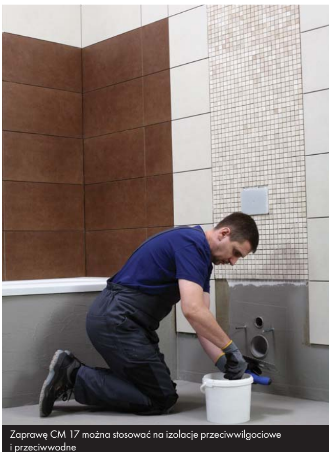
Zaprawę CM 17 można stosować na izolację przeciwwilgociową i przeciwwodną