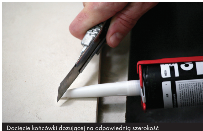
Docięcie końcówki dozującej na odpowiednią szerokość

Odciąć końcówkę kartusza tuż nad gwintem. Nakręcić końcówkę dozującą i dociąć ją odpowiednio do szerokości wypełnianej szczeliny.