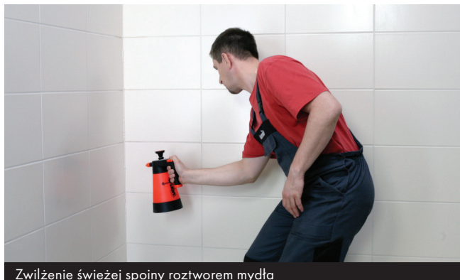
Zwilżenie świeżej spoiny roztworem mydła

W ciągu 5 minut powierzchnię wypełnienia należy spryskać wodnym roztworem mydła i wygładzić podobnie zwilżonym narzędziem, usuwając jednocześnie nadmiar materiału.